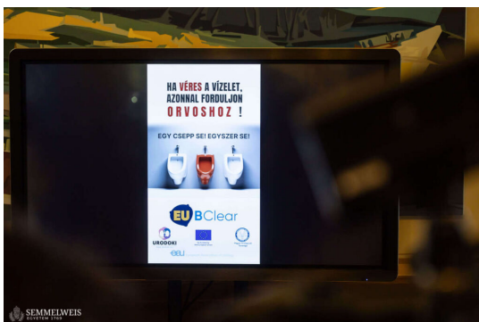
Ha véres vizelet, azonnal forduljon orvoshoz!