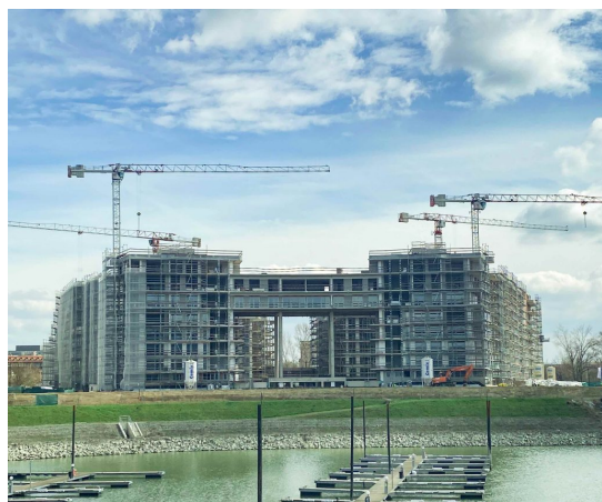
© DVM Group Duna Terasz Vista.