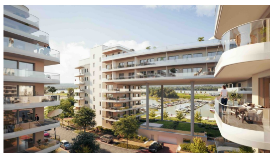
© DVM Group Duna Terasz Vista látványterv.