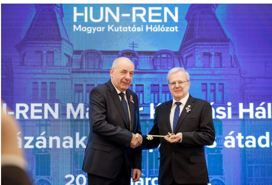
© Fotó: Kékesi Donát Sulyok Tamás államfő és Gulyás Balázs, a HUN-REN elnöke.

Eredeti tartalom: HUN-REN Magyar Kutatási Hálózat