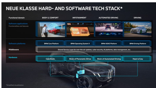
Simplified presentation of the new class software stack with the "Superbrains" foundation.