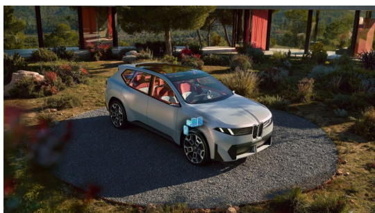
The four superbrains of the Neue Klasse, hinted at in the BMW Vision New Class X.