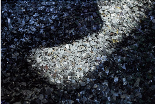
Fémfrakció az újrahasznosítási folyamat után.