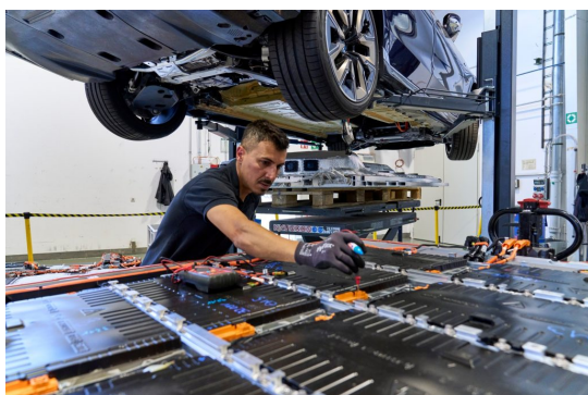
A BMW Group jelentős eredményt ér el a körkörös gazdaság terén a nagyfeszültségű akkumulátorokkal.