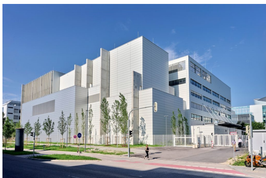
Az új aeroakusztikai központ.