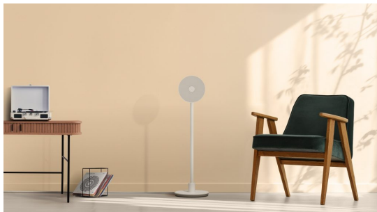
© LG Electronics LG PF600U multifunkcionális készülék.