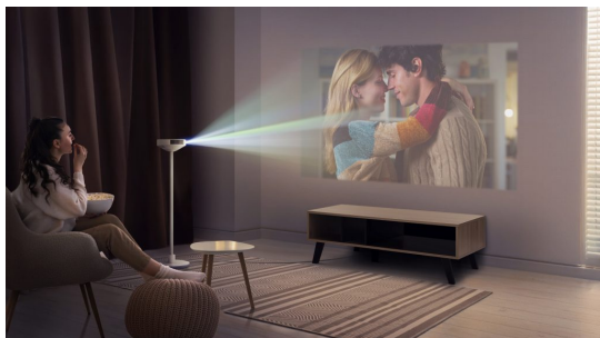
© LG Electronics LG PF600U multifunkcionális készülék.