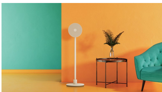
© LG Electronics LG PF600U multifunkcionális készülék.