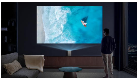
© LG Electronics LG CineBeam S, kompakt 4K UST projektor.