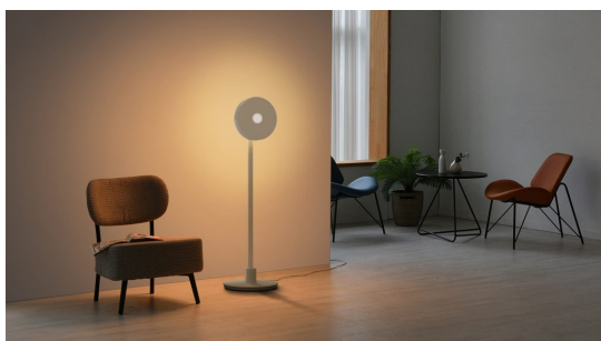
© LG Electronics LG PF600U multifunkcionális készülék.