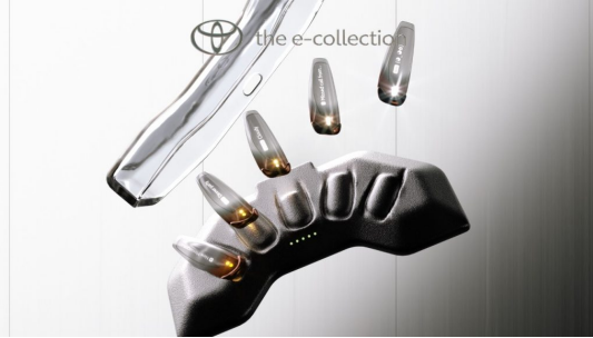
© Toyota Notification Nails - A beépített technológiát képviseli.