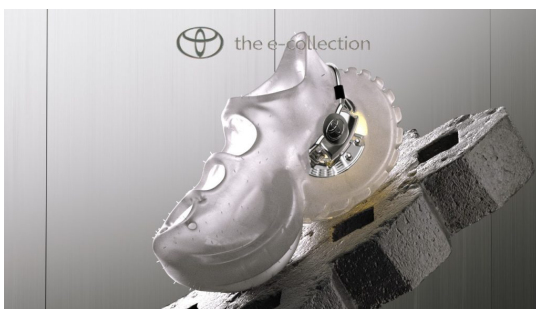
© Toyota AWD Sneakers - Az összkerékhajtás elérhetőségét tükrözi.