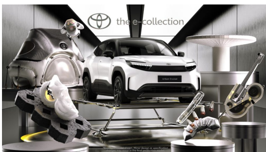
© Toyota A hoax célja pedig nem volt más, mint hogy bemutassák, legújabb, a vállalat számára kiemelten fontos akkumulátoros elektromos modelljük, a jövőre érkező Toyota Urban Cruiser különleges képességeit.