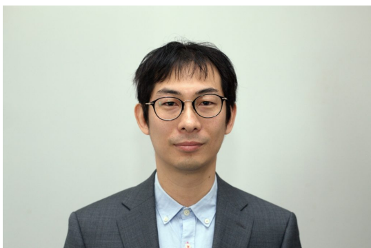
© ELTE Atomfizikai Tanszék Nagai Yoshikazu.