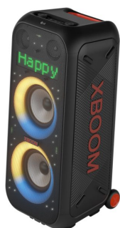
© LG Electronics LG XBOOM XL9T hordozható hangszóró.