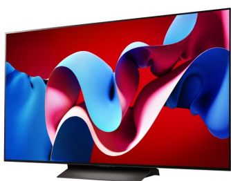
© LG Electronics LG OLED55C41LA televízió.