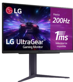
LG 27GS85Q-B UltraGear monitor.