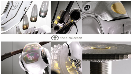
© Toyota Az e-kollekció olyan innovatív elképzelések sora, ahol a felfedezni vágyó tervezés találkozik a jövő közösségei számára épített többcélú megoldásokkal.

Eredeti tartalom: Toyota Central Europe - Hungary Kft.