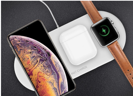
Asztali állomás, amivel egyszerre több eszközt is lehet vezeték nélkül tölteni.