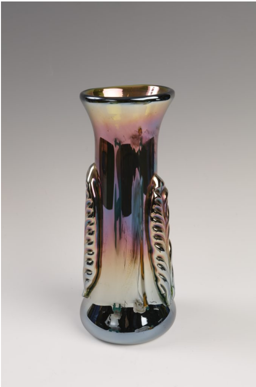
© Bohus-Lugossy Alapítvány L. Szabó Erzsébet: Csepprátétes, eozinos, kézi gyártású, színes hutaüveg (2020), Laczkó Dezső Múzeum.