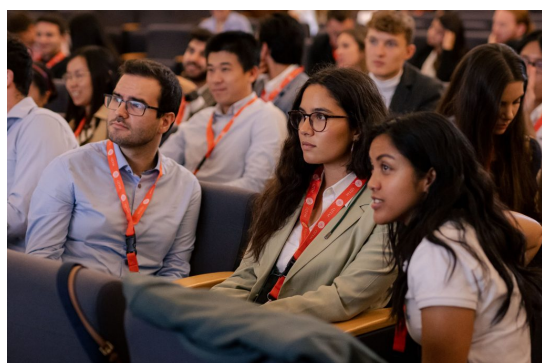
© Budapesti Corvinus Egyetem QTEM-es hallgatók.