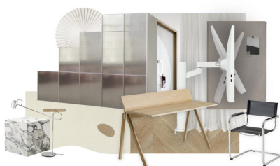
TÉGLALAKÁS GANGOS BÉRHÁZBAN