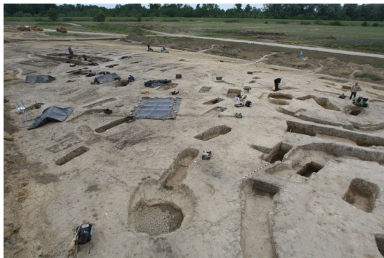
Az ELTE ásatásai a rákóczi falvi avar kori (Kr. u. 6-9. század) temetőben 2006-ban.