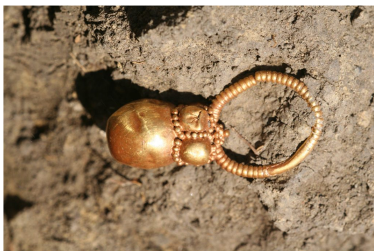
© ELTE Arany fülbevaló egy férfi sírból Rákóczi falváról, Kr. u. 7. század (Damjanich János Múzeum, Szolnok).