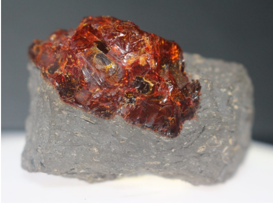
Egy darabka barnakőszézen ülő ajkai borostyánkő, másnéven ajkait.