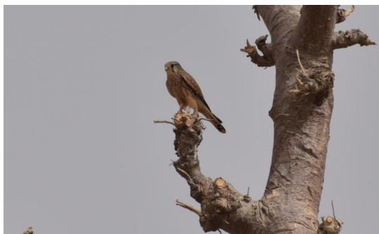
Magyar gyűrűs vörös vércse Nigériában.