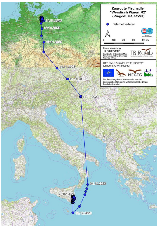
© Térkép: Christof Herrmann, Beringungszentrale Hiddensee, Landesamt für Umwelt, Naturschutz und Geologie MV A jeladós halászsas útja a jeladó felszerelésétől Szicíliaig.

Eredeti tartalom: Balaton-felvidéki Nemzeti Park