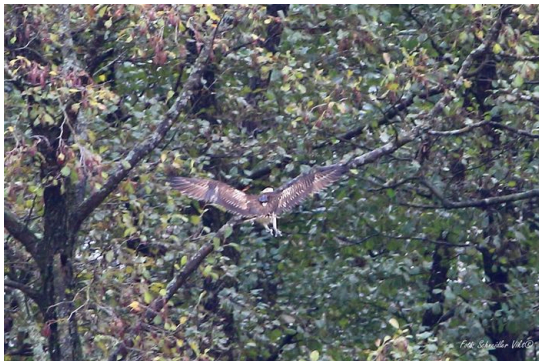
Jeladós, színes gyűrűs halászsas.