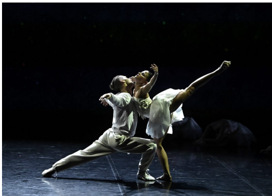
Hattyúk tava a Margitszigeten.