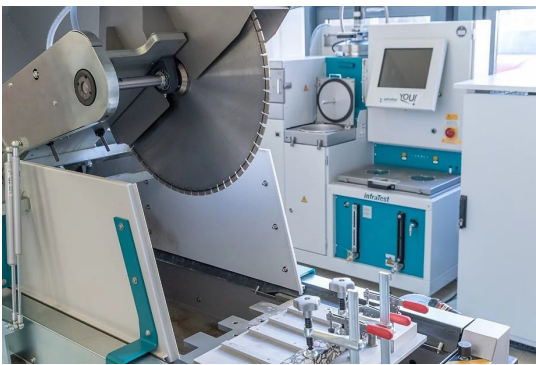
A legmodernebb technológiával szerelték fel a Széchenyi István Egyetem Útépítési Laboratóriumát.

Eredeti tartalom: Széchenyi István Egyetem