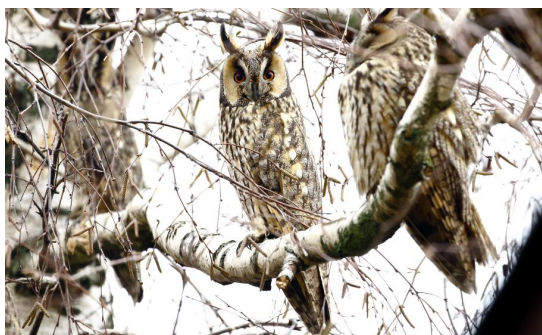
Telelő erdei fülesbaglyok Kisújszálláson.