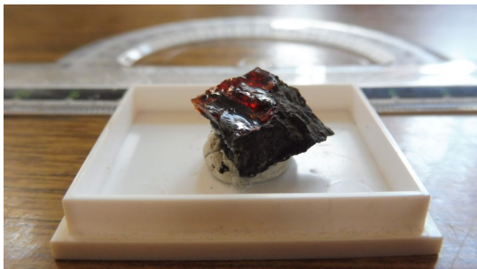
Az álskorpió-zárványt tartalmazó ajkaitdarab.