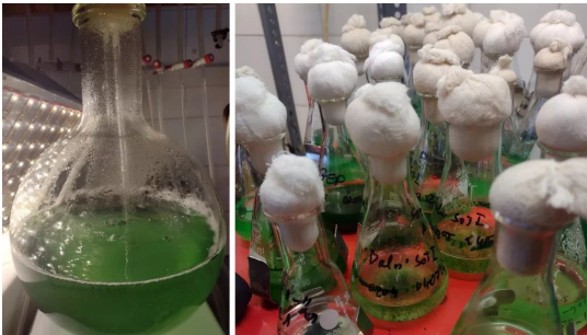
Mikroalga kultúrák tenyésztése laboratóriumi körülmények között.