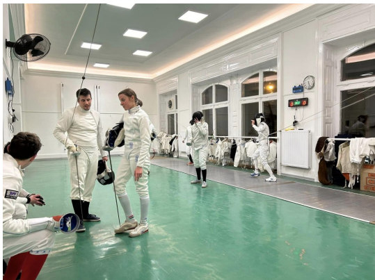
© EVC Élet a felújított teremben.