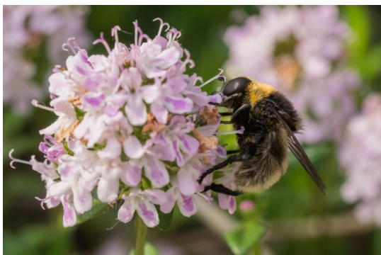
Bundás pihelég.