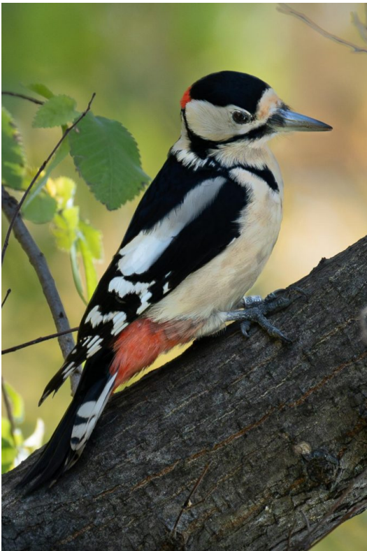
© Fotó: Balog Norbert 2023-ban készült fotó.