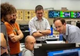
© QST/F4E A JT-60SA csapatának tagjai megvitadják az előzetes adatokat a vezérlőteremben, Naka, Japán, 2023. október.

Eredeti tartalom: HUN-REN Magyar Kutatási Hálózat