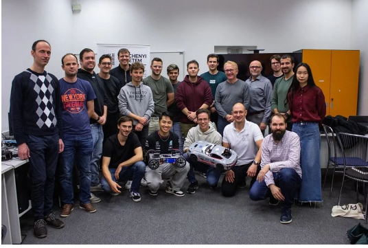
© Fotó: Horváth Márton A szervezők, valamint a program magyar és német résztvevőinek csoportképe.

Eredeti tartalom: Széchenyi István Egyetem