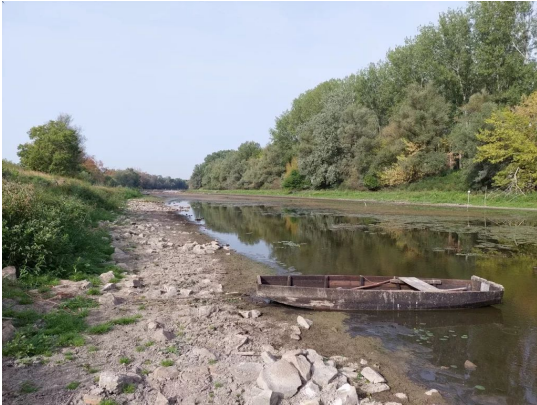
A horgászok által közkedvelt Szeremlei-Sugovica-mellékág erősen feltöltődött, restaurációja időszerű.