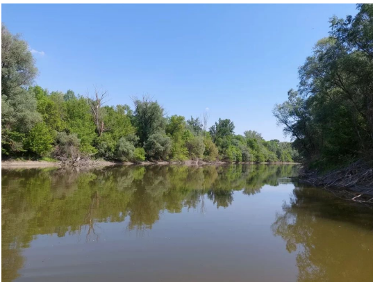
A Szabadság-szigethez tartozó Duna-mellékág az egyik legszelebb újjáélesztett mellékág a magyarországi Alsó-Dunán, melynek restaurációja a WWF Magyarország szervezésében egy LIFE+ pályázatból valósult meg.