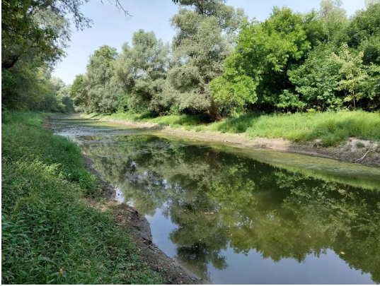
A Bezerédi-mellékág a Duna egyik értékes Mohácshoz közeli mellékága, melynek restaurációját nemrégiben valósította meg a Duna-Dráva Nemzeti Park.