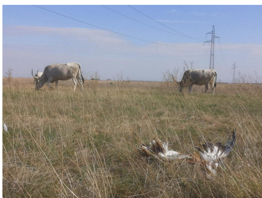
© Fotó: Engi László Ütközés következtében elpusztul túzok a nagyfeszültségű vezeték alatt.

Eredeti tartalom: Magyar Madártani és Természetvédelmi Egyesület