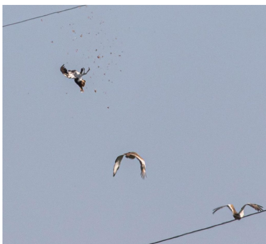
Vezetékkal ütköző túzok.