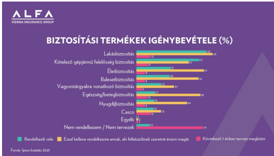
© Alfa Vienna Insurance Group Biztosító Zrt.