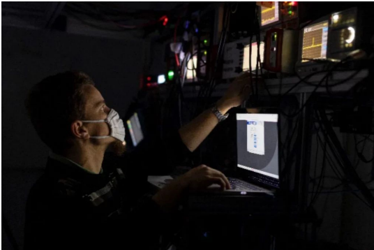
Mérések a Wigner FK kvantumoptika laborjában.