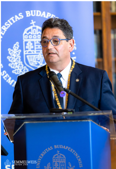
Semmelweis Egyetem dr. Merkely Béla, az egyetem rektora