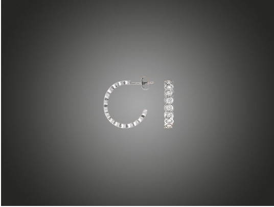
© BÁV ART Aukciósház és Galéria Briliáns fülbevaló.