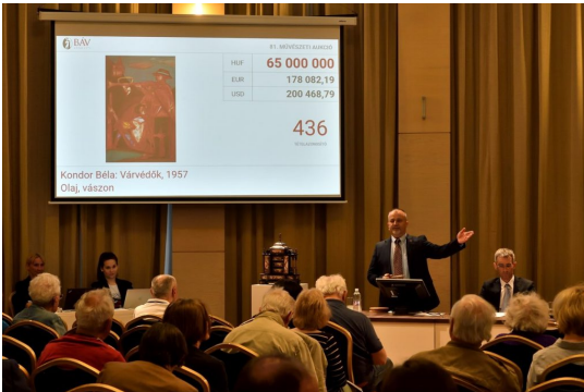
Több rekordot is megdöntött a Várvedők.