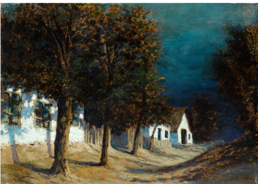
© BÁV ART Aukciósház és Galéria Szepesi Kuszka Jenő Falusi utca című műve.

Eredeti tartalom: BÁV ART Aukciósház és Galéria