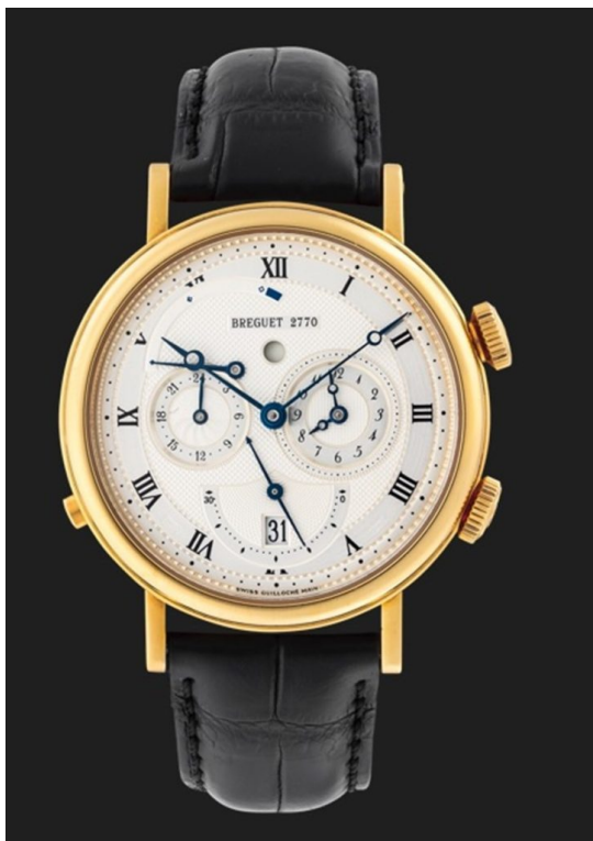
Breguet Le Réveil du Tsar arany férfi karóra.