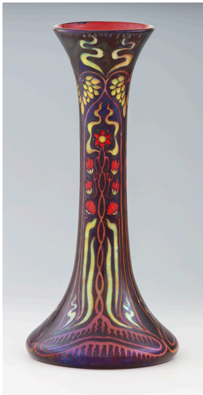
Szecessziós trombitaváza.