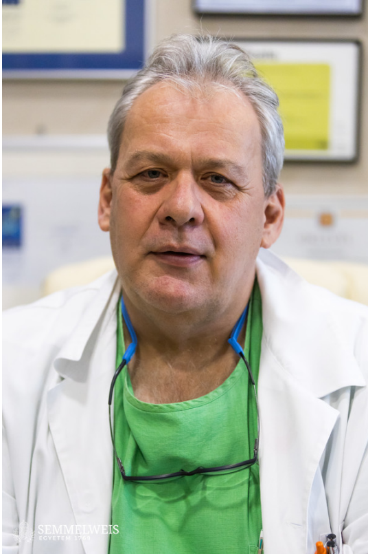
© Fotó: Barta Bálint - Semmelweis Egyetem dr. Kopa Zsolt, a Semmelweis Egyetem Urológiai Klinikáján működő Andrológiai Centrum vezetője